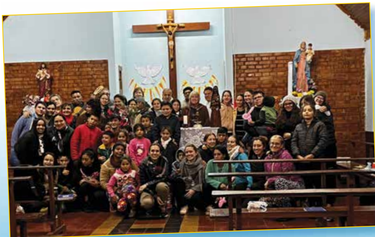
Zadnji dan misijona, zaključna sv. maša. Na sliki je misijonska skupina z otroki in drugimi domačini mesta Eldorado ob slovesu.