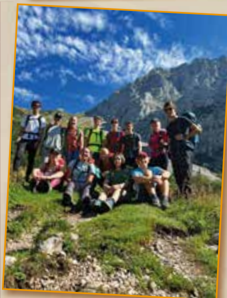
Dvodnevni izlet na Kamniško sedlo Spdt

začeli zavedati, kako pomembni sta telesna dejavnost in skrb za zdravje. Pa naj bo to ura plesa, dan na snegu, 30-minutni trening v dnevni sobi, obisk fitnesa, plavanje v morju, izlet v hribe, kolesarjenje, tek v mestnem parku, skakanje na koncertu, supanje, sprehod v naravi ali celo ... stavka zaradi podnebnih sprememb. Na to slednje je na tisoče mladih po vsem svetu opozarjalo prav na dan slovenskega športa. Petki za prihodnost ostajajo živi, saj nas večina ve, da vse pogostejše ekstremne razmere – na eni strani suše s požari, kot smo jih doživeli to poletje, na drugi strani pa grozne poplave ob neustavljivem dežju – otežujejo življenje vsem prebivalcem Zemlje in uničujejo ekosisteme. Kakršenkoli ukrep proti podnebnim spremembam je danes več kot dobrodošel, zato je pomembno širiti ozaveščanje o tem, kar se okoli nas dogaja. Če to vključuje tudi gibanje na svežem zraku, še toliko bolje, saj tako predstavlja dvojno poučno svarilo za vse nas: bodisi o pomenu športa bodisi o pomenu zavedanja, kako in zakaj se naš svet spreminja. Oboje je pomemben del zdravega življenjskega sloga. Gradimo lahko na majhnih spremembah. Seveda je še bolje, če v njih uživamo.